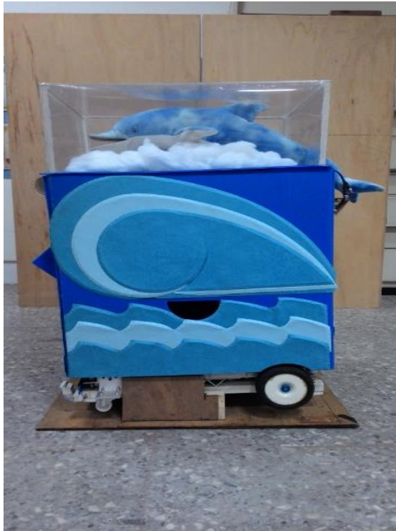
圖片說明:左邊輪胎裝有一顆直流馬達