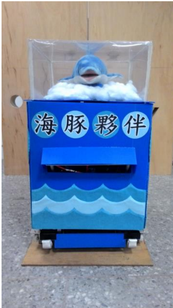
Fig.1. 創思機器人 --- 正視圖。