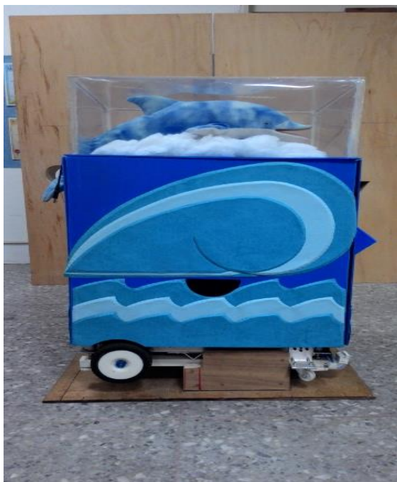
Fig.3. 創思機器人 --- 右側視圖。