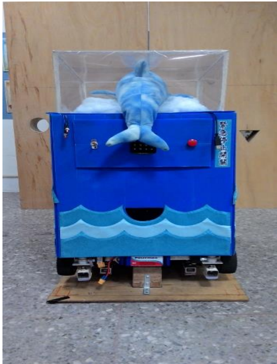
Fig.2. 創思機器人 --- 後視圖。