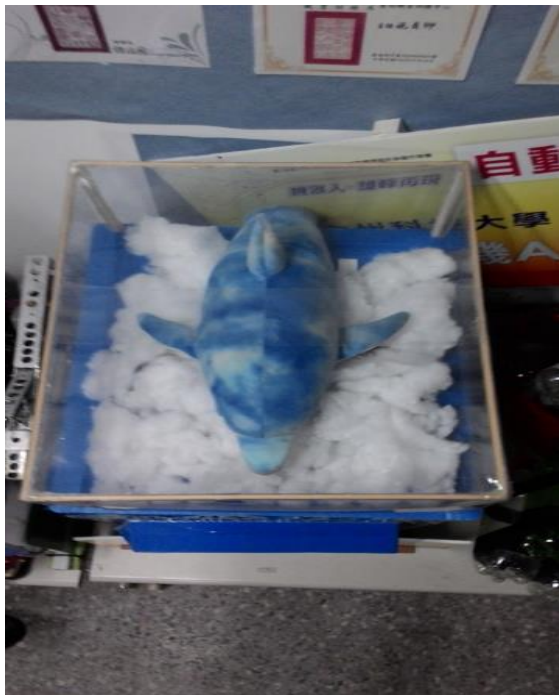
圖片說明: 上方裝有海豚來頂球