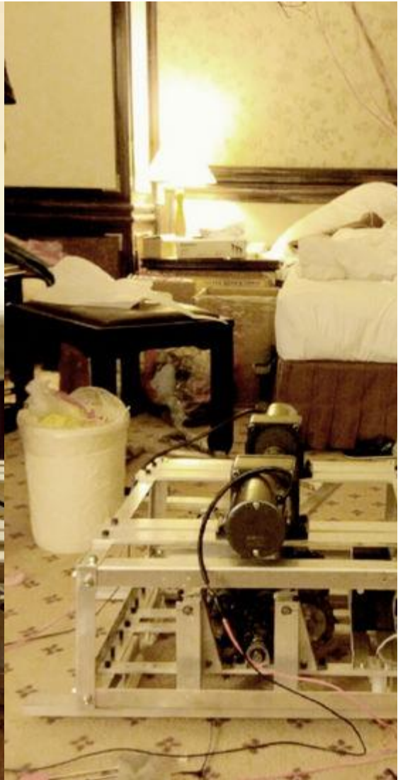
說明：架構採用鋁合金，較為堅固耐用。