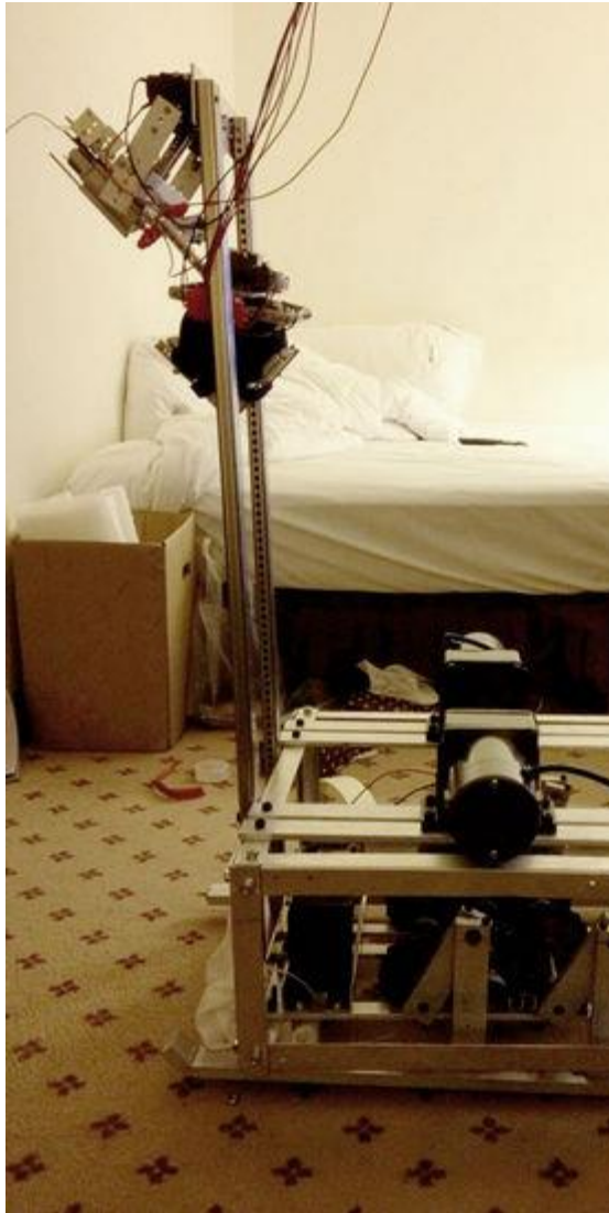
說明：架構採用鋁合金，較為堅固耐用。