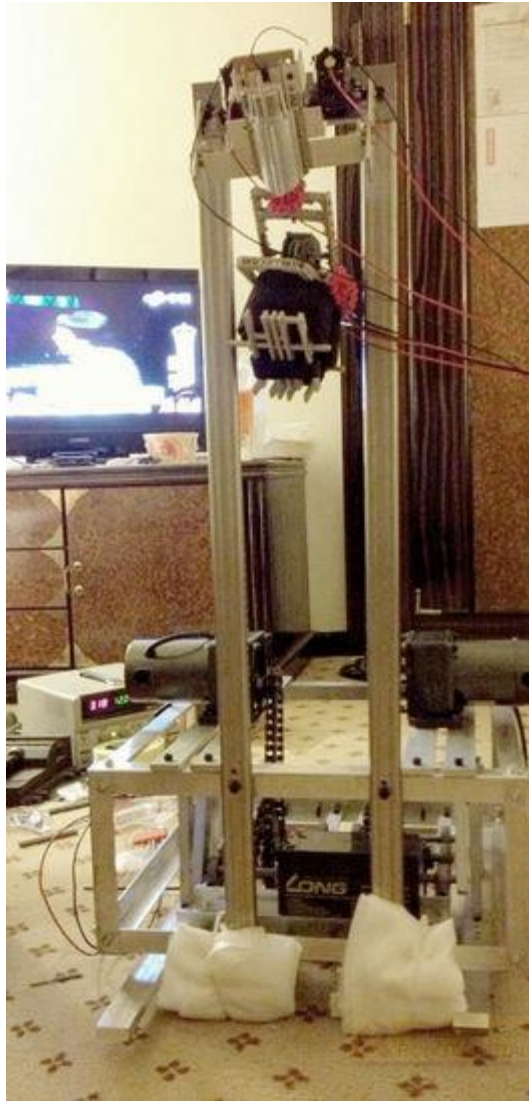
說明：機器人架構以長條鋁架組成，外型較為方正整齊。