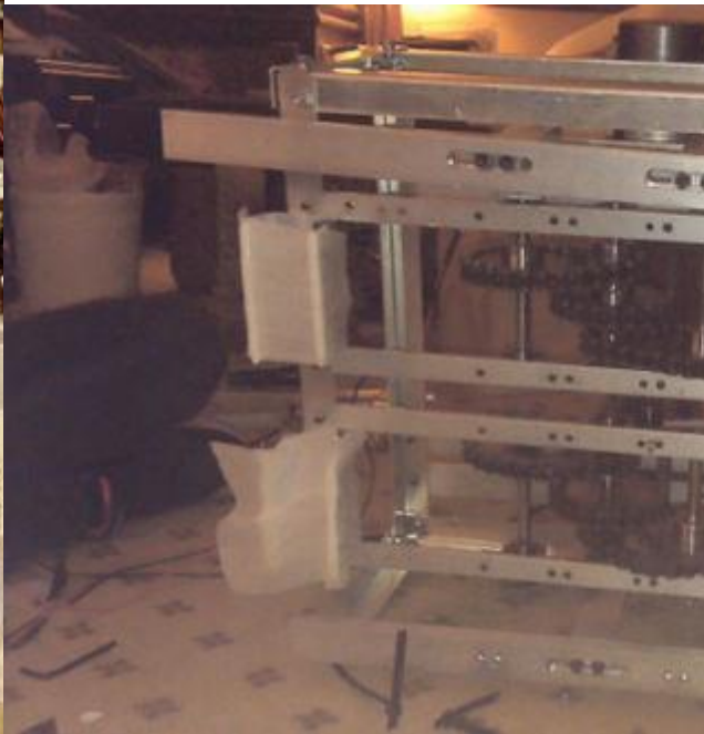
說明：底部加上海棉，使機器人架構不回會因為撞擊而造成機構損毀。