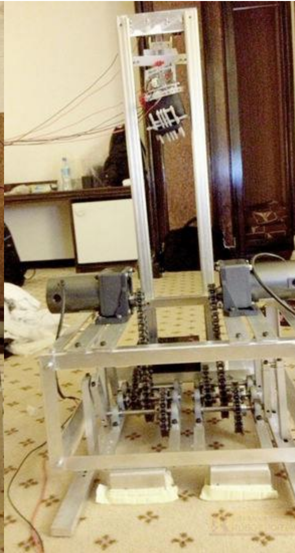
說明：腳部由齒輪及鏈條帶動，以達成機器人走路之要求。