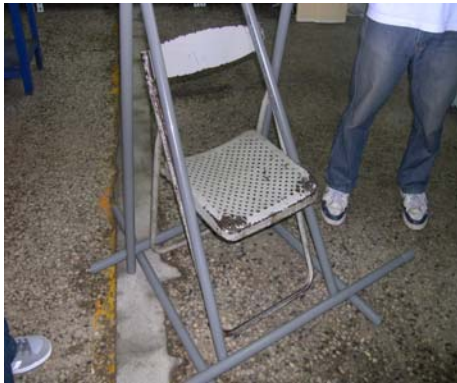
圖：材料：PVC 硬質導電線用管E管。