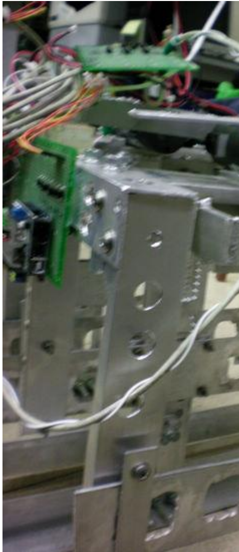
說明：機器人整體使用手提電鑽鑽洞，增加美觀。