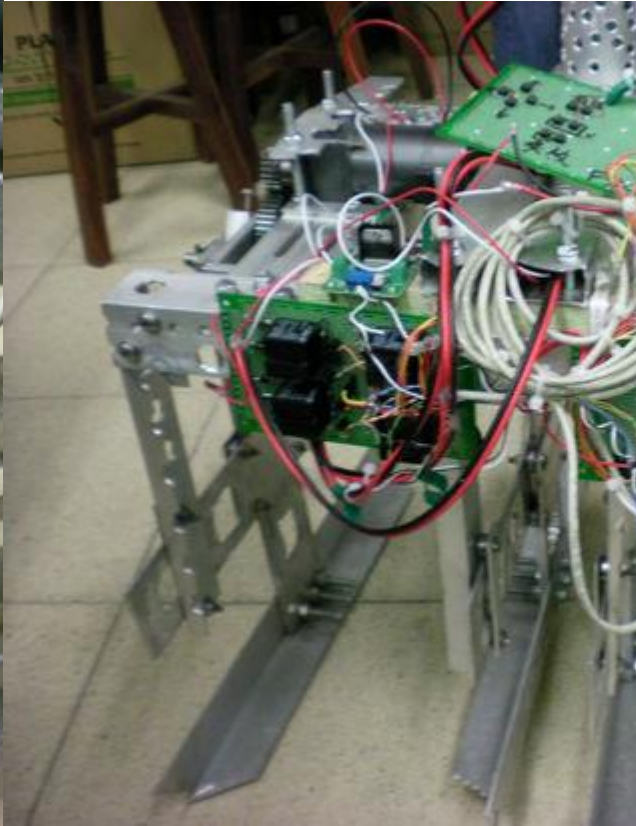
說明：機器人整體使用手提電鑽鑽洞，增加美觀。