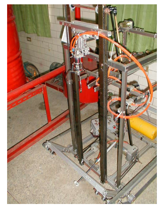
圖 6 氣壓夾爪之升降機構