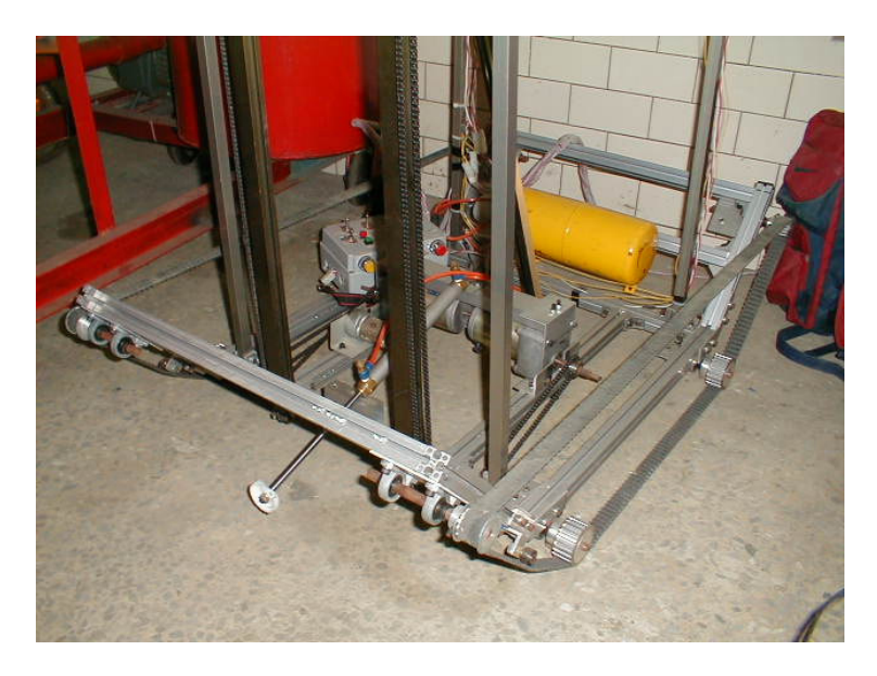
圖 8 行動機器人之底盤