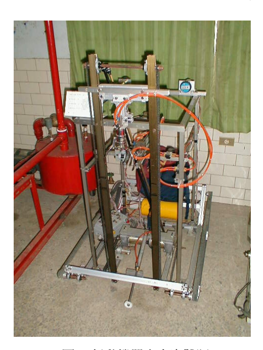
圖 4 行動機器人之實體照

顛簸路面,是為了要測試夾取阿斗的機構,是否會因為劇烈的震動而使阿斗掉落,雖然鳳翔 號底盤的重心很穩,但是搭載在底盤上各式機構的重量與配置方式也會影響整體機器人的穩定 性,所以顛簸路面是對整體機構設計的一大考驗,尤其是抓取與運送機構更要將阿斗緊緊地抓 牢,以避免掉落。